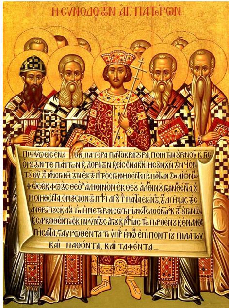
Erstes Konzil von Nicäa (325); Kaiser Konstantin entrollt den Text des Nicäno-Konstantinopolitanum